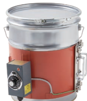
Fタイプペール缶用ヒーター [100V] [200V] TH-D-30001