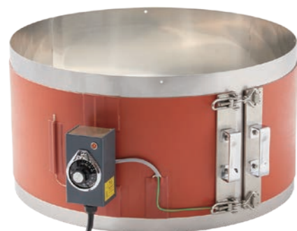
Fタイプドラム缶用ヒーター [100V] [200V] TH-D-30000